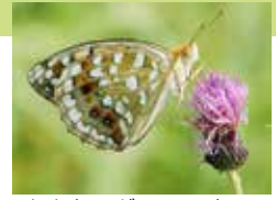
オオウラギンヒョウモン