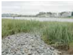
ウモレベンケイガニの保全のためのヨシ原再生