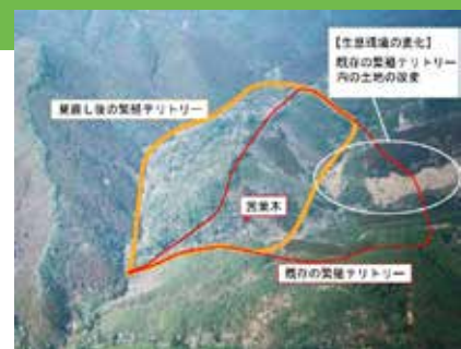
工事影響後の行動圏内部構造予想図