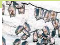
コキクガシラコウモリ