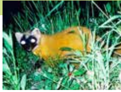
テン (夜間自動撮影による)