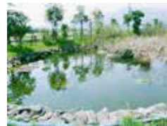
希少な植物・魚類の生息場再生